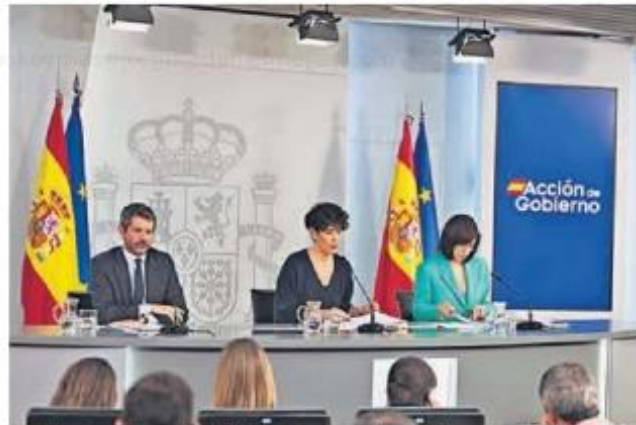
Los ministros Ernest Urzua, Elma Sáiz y Diana Morant, ayer en la rueda de prensa posterior al Consejo.

Sáiz ha recordado que el bono cultural nació como respuesta a la pandemia del covid y "se ha consolidado