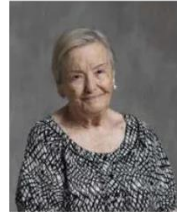
La actriz sevillana.