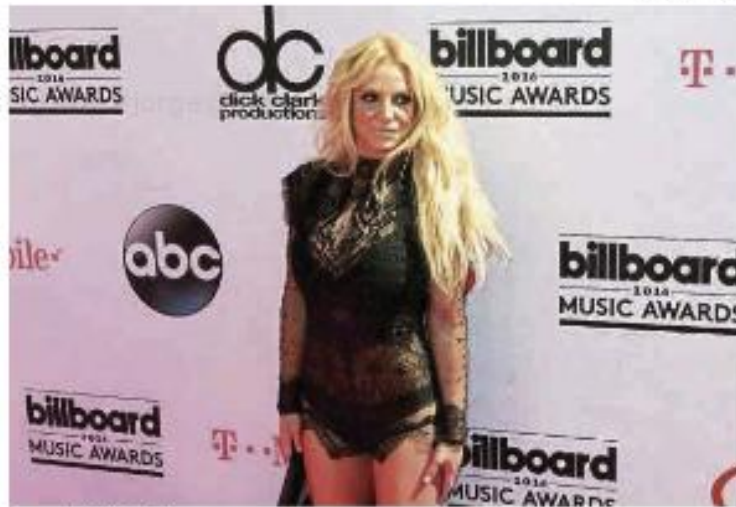
La cantante Britney Spears.

Diferentes medios especializados coinciden en que la causa judicial sigue su curso y que la artista tiene prevista una comparecencia ante el juez el próximo 4 de mayo, un calendario que sitúa