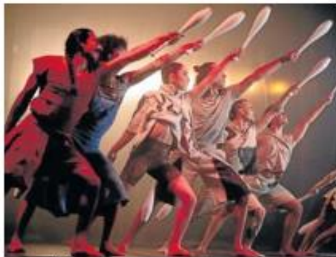
La compañía, durante una de sus representaciones. ZIRKUSS