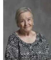
La actriz sevillana.