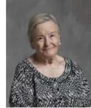
La actriz sevillana.