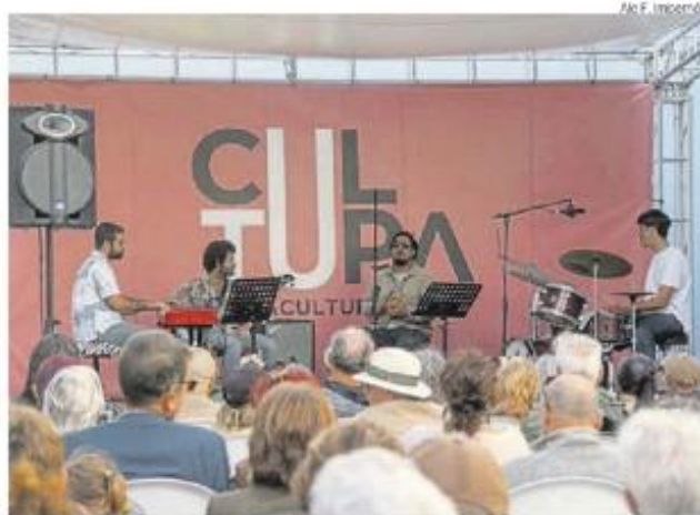
Concierto de La Cofradía la semana pasada en el Palacete Rodríguez Quegles, en el marco del Deriva Jazz II.