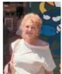
Quiero felicitar a la mejor madre, abuela, mujer y jefa. Gracias por ser luz, guía y refugio.