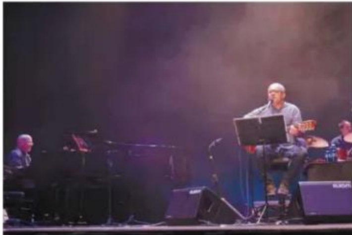
Un momento del concierto en el Auditorio Barañain.