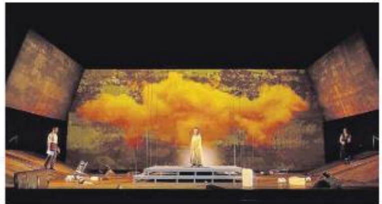
Una escena de 'Yerma', una producción de Auditorio de Tenerife.

Yerma se estrenó en el Auditorio de Tenerife el pasado mes de octubre. En el primer trío de la presente temporada de Ópera de