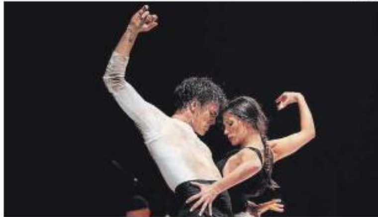
Imagen de la compañía madrileña de flamenco La Venidora.