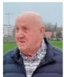
84 años de amor que compartes sin medida, te queremos, papá, abuelo, amigo...