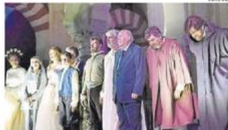
Actores, durante una representación de la obra de Calderón de la Barca, en la Mezquita-Catedral de Córdoba.

viernes 22 de mayo la representación del auto sacramental El gran teatro del mundo , escrito por el dramaturgo Calderón de la Barca, prolífico autor del Siglo de Oro español.