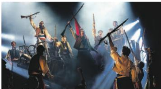
Una escena del musical Los miserables .

Las tres obras optan a cuatro categorías cada una en los grandes premios de las artes escénicas, que se entregarán el 18 de mayo