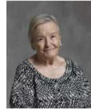
La actriz sevillana.