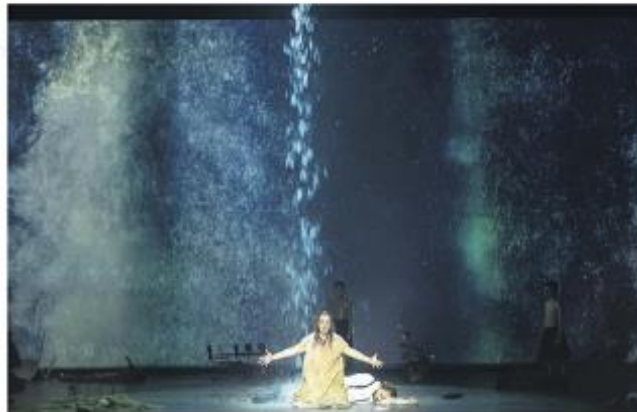
‘YERMA’ SE ESCENIFICÓ EL PASADO AÑO EN EL AUDITORIO DE TENERIFE.