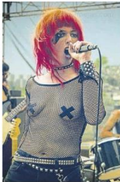
Una escena de 'Violentas mariposas', que llega a València este jueves

Sobre el por qué se ha elegido este largometraje, que se podrá ver en Madrid, Barcelona, Galicia y Mallorca -dependiendo del éxito- durante una semana desde el