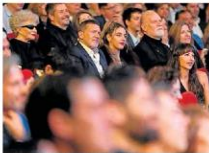
Antonio Banderas, durante la ceremonia.

condujeron la gala, que contó con la presencia del ministro de Cultura, Ernest Urteagan y el presidente de la Academia de Cine, Fernando Méndez-Lette, entre otros. Una ce-