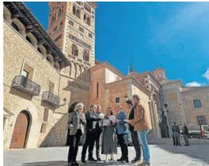
Presentación del programa ante la torre mudéjar de la catedral. HA

Entre los proyectos del programa, figura la edición de un libro y