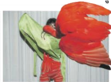
Fotografía de la exposición Lux & Umbra.